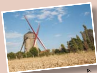
Moulin du Pont de Guemps