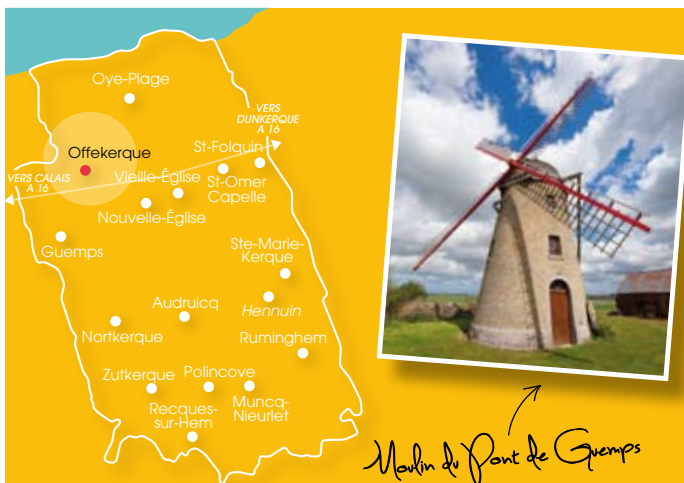
Moulin du Pont de Guemps